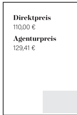
1/8 Seite quer S 89 x 63 mm