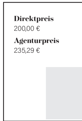
1/4 Seite hoch S 89 x 130 mm