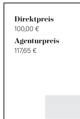
1/8 Seite quer S 89 x 63 mm