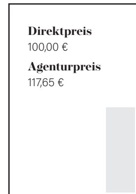
1/8 Seite hoch S 43 x 130 mm