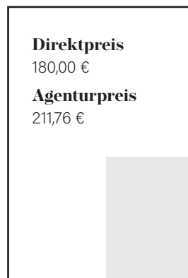
1/4 Seite hoch S 89 x 130 mm