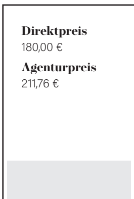
1/4 Seite quer S 182 x 63 mm